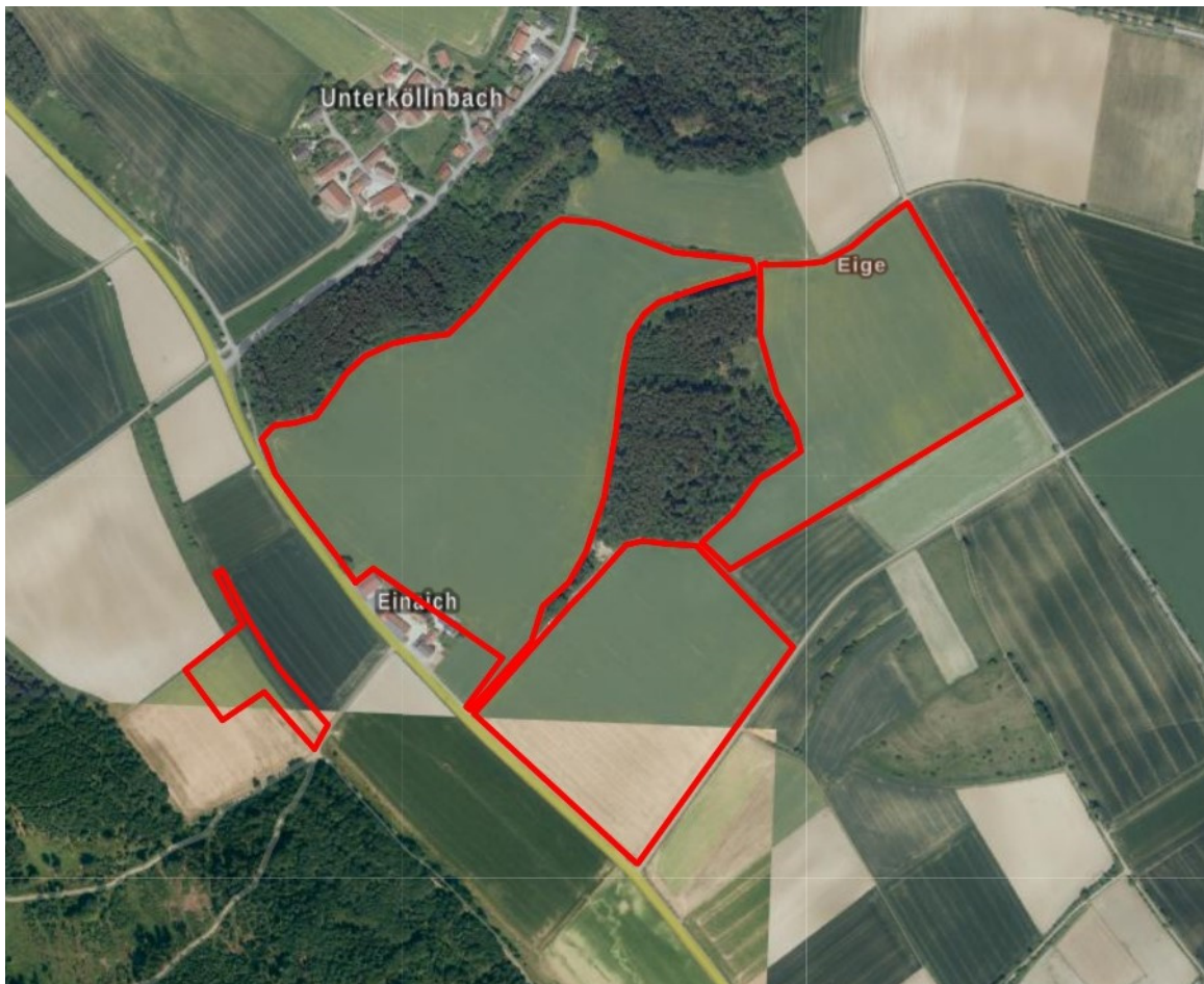
Abb. 2 Umgriff des Geltungsbereichs im Luftbild (rot). Ohne Maßstab.

Fehler! Verweisquelle konnte nicht gefunden werden. zeigt den Umgriff des Deckblatts in der Topographischen Karte.