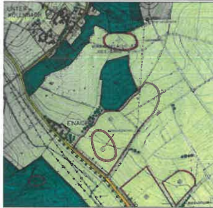
RECHTSKRÄFTIGER FLÄCHENNUTZUNGSPLAN DER GEMEINDE POSTAU